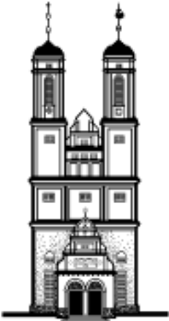
KIRCHE ZUM VATERHAUS