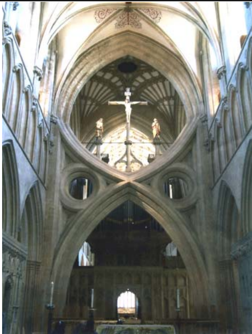
Kathedrale in Wells (Südengland) zur Osterandacht