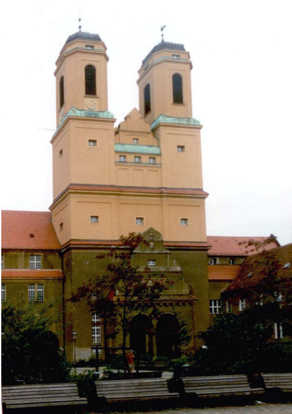
KIRCHE ZUM VATERHAUS

Bericht des Gemeindegemeinderates Februar 2007